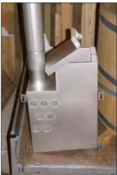
Edelstahlofen als Heizeinheit